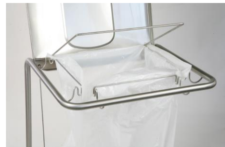
Fermasacco in acciaio inox